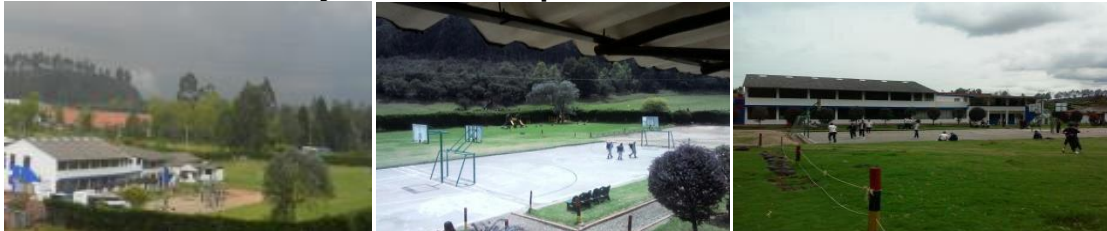
Foto Aulas y Dotación adecuada