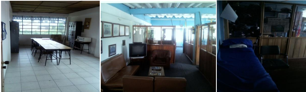
Foto Sala de Audiovisuales y Aula Especializada