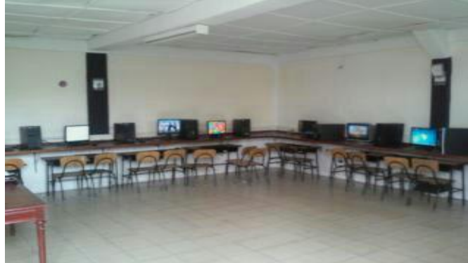
Foto. Sala de Cómputo