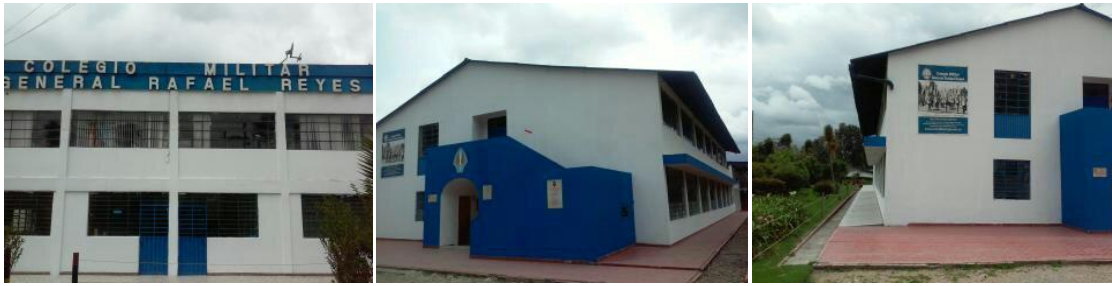
Foto Área recreativa y zonas libres por estudiante